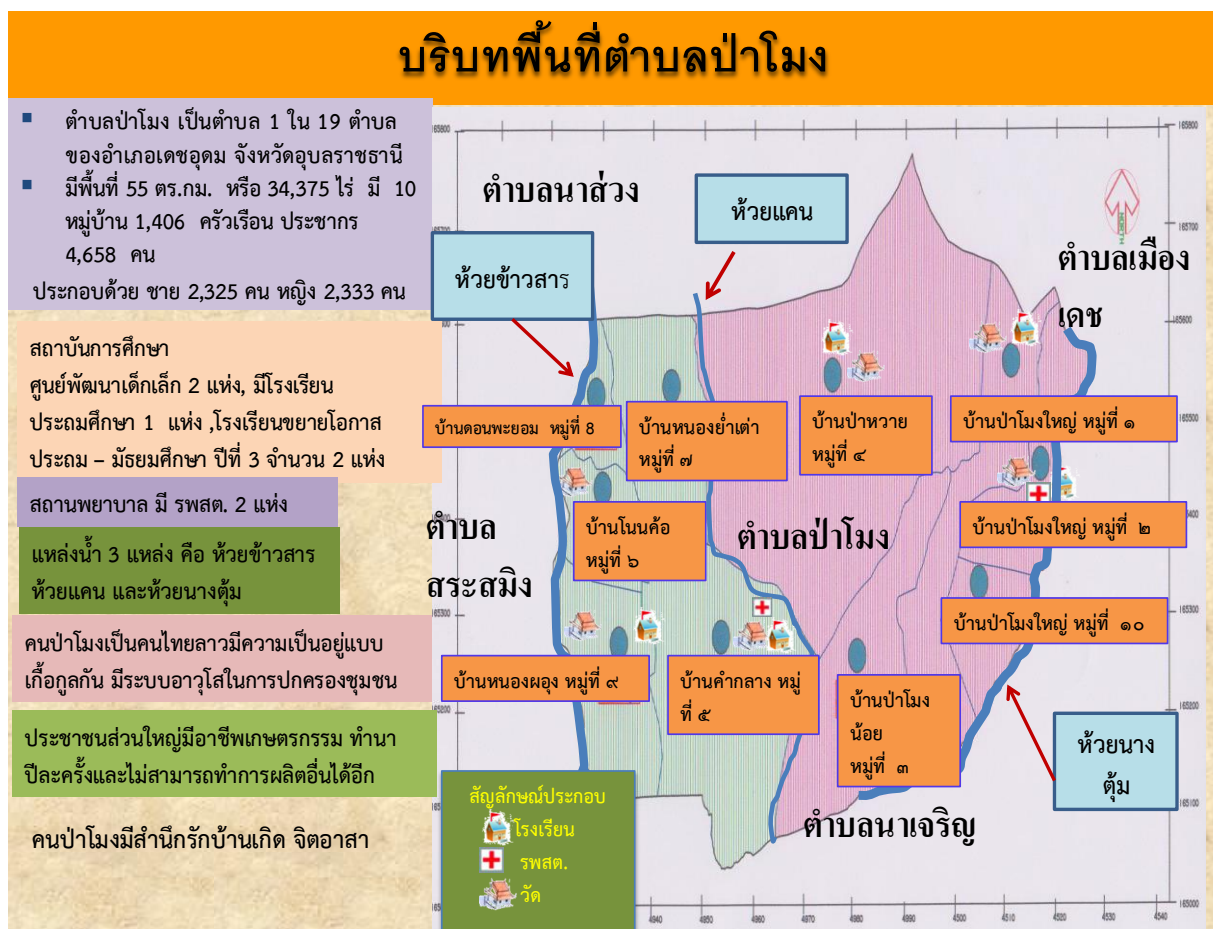
แผนภาพที่ ๑.๒ แผนที่แสดงทางการเดินเข้าตำบล

สภาพทั่วไปของตำบลป่าโมง มีลักษณะภูมิประเทศขององค์การบริหารส่วนตำบล ป่าโมง เป็นที่ราบสูงและอากาศค่อนข้างแห้งแล้งประชากรส่วนใหญ่ ประกอบอาชีพหลายอาชีพ เช่นรับราชการ รับจ้างทั่วไป การเกษตร ทำนา ค้าขาย ฯลฯซึ่งสามารถจำแนกได้ว่า มีอาชีพเกษตรกรรมร้อยละ ๔๐ อาชีพรับจ้างร้อยละ ๔ และอาชีพค้าขายและรับราชการ ร้อยละ ๑ นอกจากนี้้องค์การบริหารส่วนตำบลป่าโมง ยังได้ให้การสนับสนุนกลุ่มอาชีพต่าง ๆ ภายในตำบลเพื่อเป็นการสร้างรายได้และลดรายจ่าย